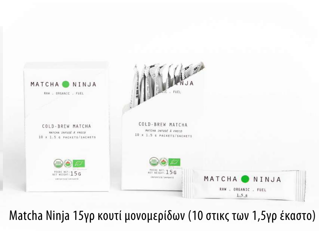
Matcha Ninja 15γρ κουτί μονομερίδων (10 στικς των 1,5γρ έκαστο)