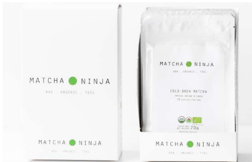
Matcha Ninja 70γρ σακουλάκι (70 μερίδες)